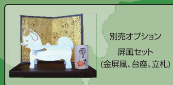
別売オプション 屏風セット (金屏風、台座、立札)