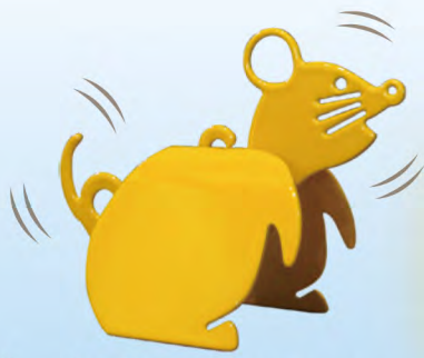
平滑ゴールデンイエロー